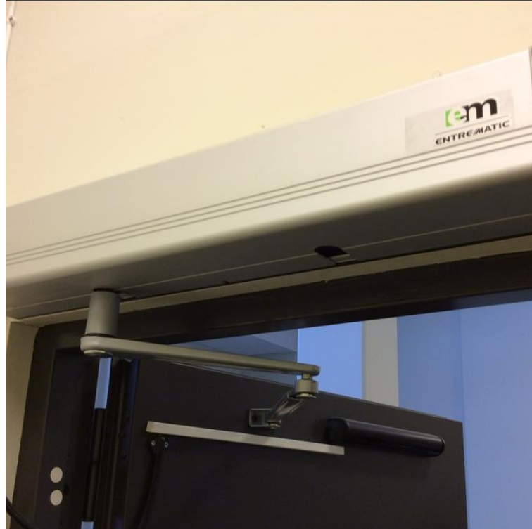
Bildnr: 1 av 1

BARNVAGNSFÖRR ÅD 1 11819 7 EE 1 VÄGG 4 LÖST LOCK